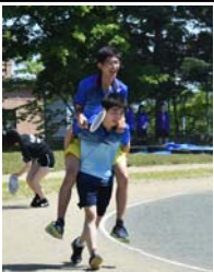
↑部局対抗リレーの様子

それぞれの教室で出し物をしたり、また創薬部によるライブなど行う。文化祭の最後にはグラウンドに花火が上がると、毎年大盛り上がり。後半の2日間の体育祭では、1年次、2年次、3年次の同じクラスの人たちが一丸となって縦割りの優勝を目指す。また、縦割りクラスで行うそれぞれ違った陣も見物だ。