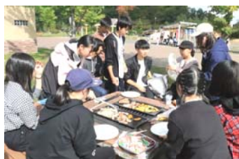
↑皆で楽しく野外ランチ

と交流を深めるもよし、写真を撮るのもよし。美味しいものをお腹一杯になるまで食べて、いい思い出を作ろう。