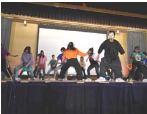
↑圧巻のステージ発表

毎年7月半ばに4日間にかけて行われる旭丘高校最大の行事。前半2日間の文化祭では、各クラスがステージでパフォーマンスを行ったり、