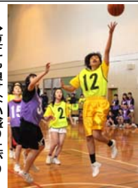
→夏にも負けない盛り上がり

旭丘祭同様、縦割りの対抗で2日間に渡って行われる。バスケットボールと卓球の2種目に分かれて行い、体育祭の最後には、2年