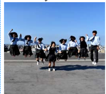
校舎屋上で局員が大ジャンプ! (この日は2人お休みでした)