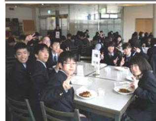
↑クラスの絆が深まります

旭丘高校に入学して初めての行事。毎年恒例のクラス対抗校歌コンクールで競ったり、学年共通の本を読み、感想や意見を話し合う読書会を開いたり、レクリエーションでクラスの絆を確かめるなどして、充実した2日間を過ごす。校歌コンクールやレクリエーションでは優勝クラスと準優勝クラスに豪華な景品ももらえる。一昨年までは北広島で行わ