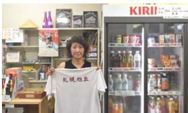
↑ 関西弁女子(と、旭丘高校オリジナルTシャツ)が待っています！

旭丘高校の購買部は通称AKB(あきびがおかこうみんぱいってん)と呼ばれ、生徒や先生に親しまれている。皆さんの中には、学校の購買でお弁当を買うことや、友達と一緒に冷たい飲み物を買う、青春を過ごすことに憧れを抱いている人も多いのではないだろうか。購買にはおにぎりやパン、飲み物などの食品はもちろん、ノートやファイル、消しゴムなどの文房具などの品揃えも豊富だ。さらにプリンやジュースが冷えた状態で販売されており、暑い夏にも最適。お弁当の注文も可能だ。朝のうちに予約をしておくとお昼に受け取ることができるので、お弁当を忘れてしまったも空腹に耐えながら1日を過ごすなんてことにはならない。 文房具を買いだすだけではないものが売っていないという人でも大丈夫。購買の方に「〇〇がほしいです」と言えば2〜3日後には入荷